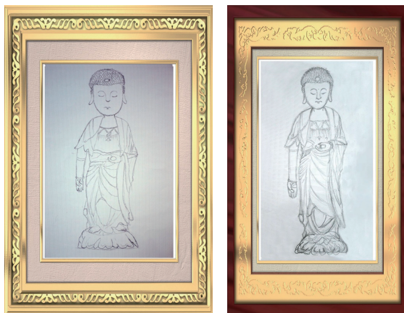
▲師公手繪阿彌陀佛像