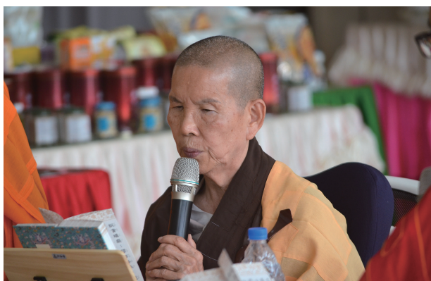
釋明誠領寺眾弟子稽首

今日，正值迎春暖花初萌，弟子釋明誠領合會眾等，跪投於您的青蓮座下，誠表丹忱，同參隨從觀音菩薩入寶莊嚴道場中，親見佛坐於寶師子座，其座純以無量雜摩尼寶而用莊嚴，深觀此文中的法義，明了佛於無限時空、廣修無量法門、津濟無邊眾生、致使無量雜摩尼寶而用莊嚴，能與無央數菩薩摩訶薩同俱於《大悲心陀羅尼經》道場，我等當於此刻，入普賢之願海、行觀音之大悲、成文殊之深智、不違我等本師釋迦牟尼佛之教化——入佛知見、行菩薩道、明菩提心；眼界深遠、心思縝廣、器量宏大，迎接《千手千眼觀世音菩薩廣大圓滿無礙大悲心陀羅尼經》。