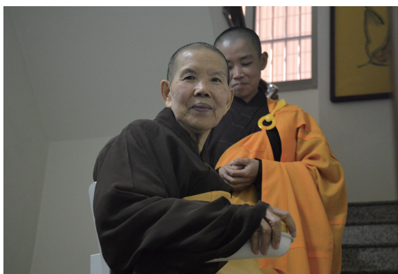
釋明誠領寺眾弟子稽首

眾等就於佛陀的寶莊嚴師子座下，誠求一願～善知揀選正法而聽聞，善知拾起正念而思惟，善知巧運正觀而修持；終至，圓滿透徹地進入「入流亡所，所入既寂，動靜二相，了然不生。」